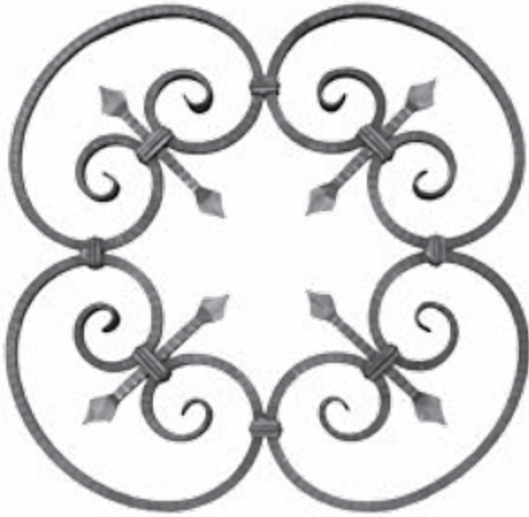
FG2310 600 X 600