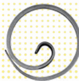
FE1931 ø 110 ■ 12 X 6