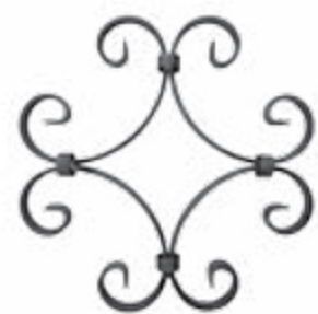
FG2304 230 X 230