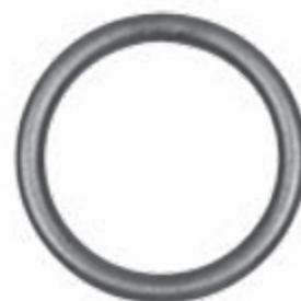
FE1906 ø 110 ■ 12