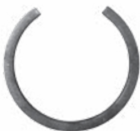
FE1908 ø 110 ■ 20 X 6