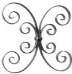
FG2306 250 X 250