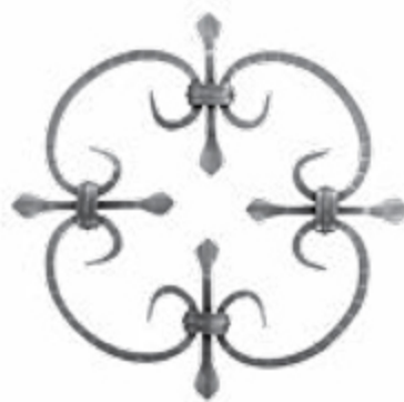
FG2308 250 X 250