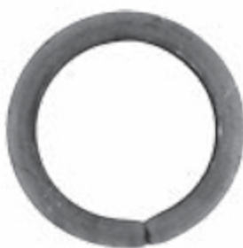
FE1903 ø 110 ■ 14